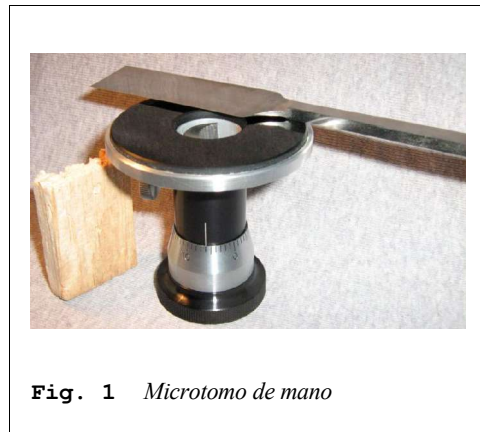
Fig. 1 Microtomo de mano

2) Técnica: Se corta una, con el microtomo de mano, y una navaja de afeitar, una fina lámina, debe ser casi transparente, de la patata y se coloca con una gota de agua entre un porta y un cubre (ver figura).