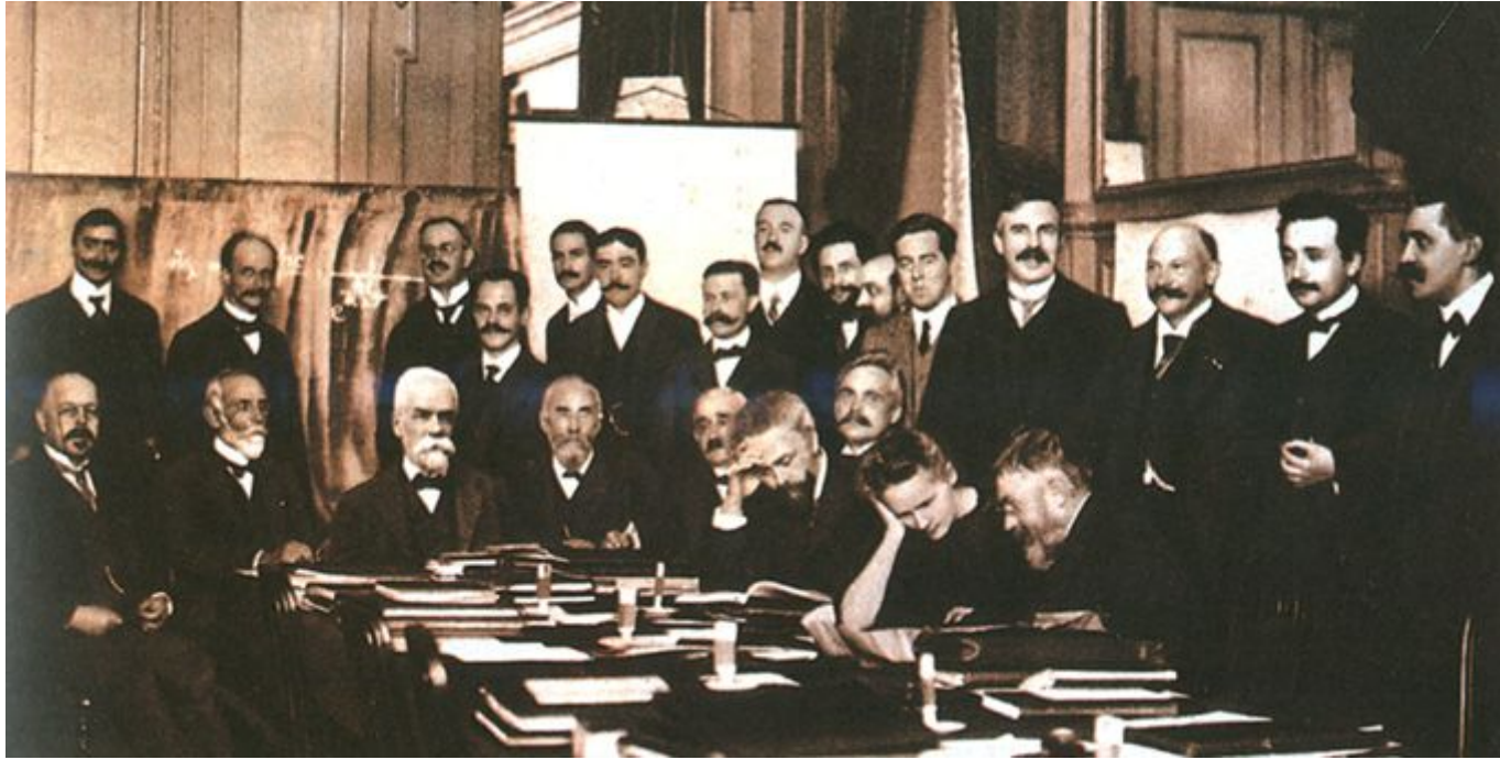
Congreso Solvay de 1911