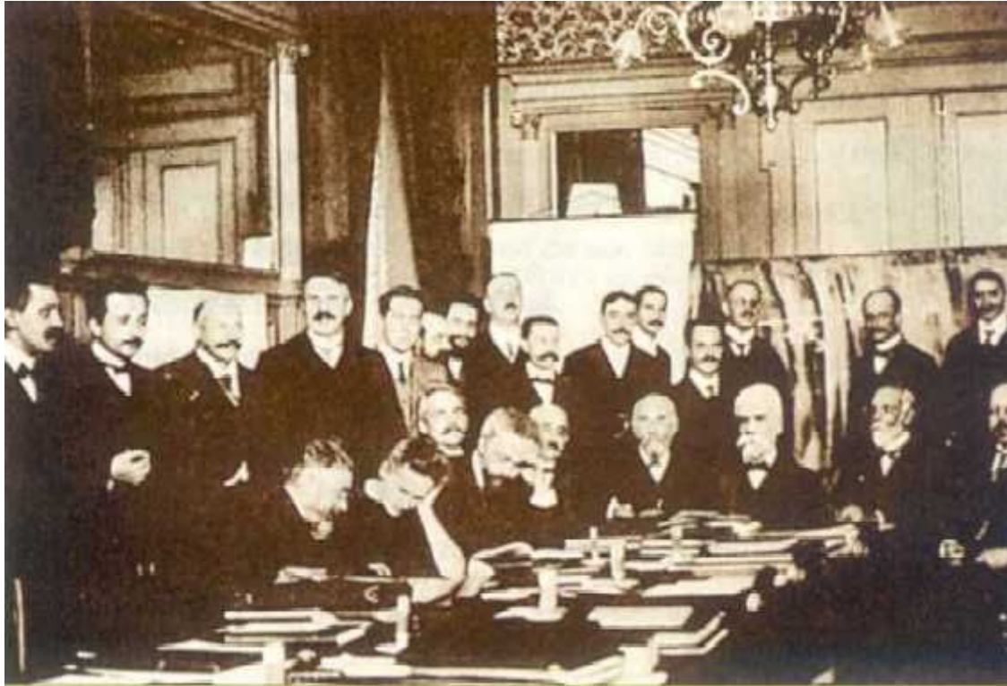
Congreso Solvay (1911)